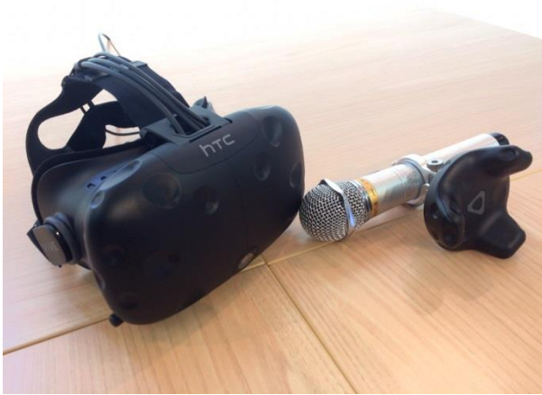
VR 専用ゴーグル、マイクの写真

プリズムプラスと大庄は、『Fantasy VR Stage+』の展開を通じて、カラオケボックスの新たな魅力を生み出し、誰もが手軽に楽しめる「非日常の音楽・映像エンタテインメント」を積極的にご提供してまいります。